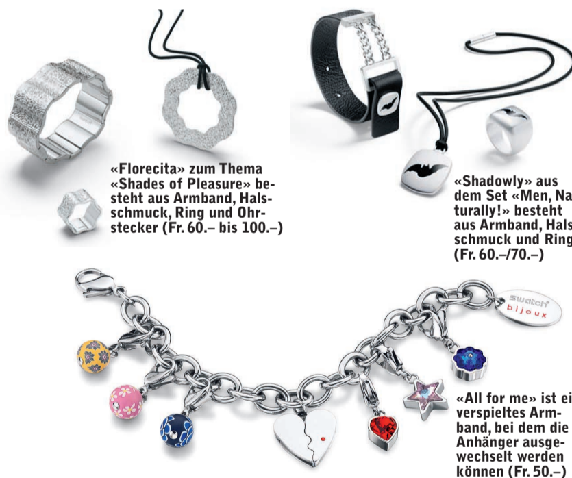
«Florecita» zum Thema «Shades of Pleasure» besteht aus Armband, Halschmuck, Ring und Ohrstecker (Fr. 60.– bis 100.–)

Erhältlich im Fachhandel; www.swatch.com